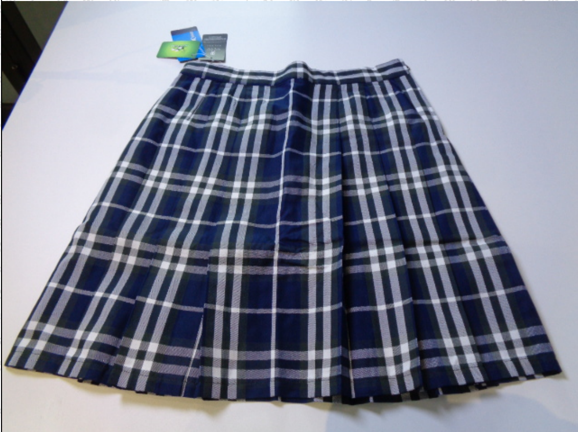
藏青/灰/白格子短裙